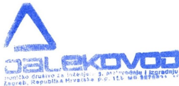
Eugen Paić-Karega član Uprave